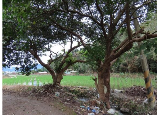
工區三生態保全對象-茄苳大樹