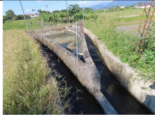
工區一及工區二施工終點環境