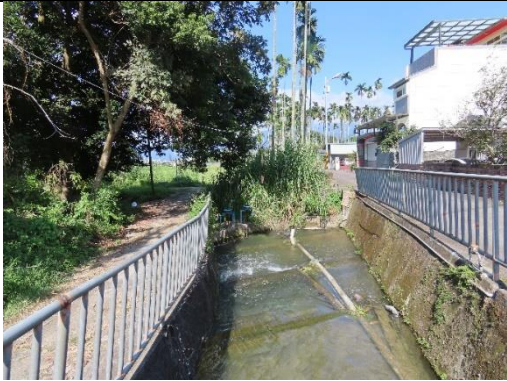
工區一及工區二施工起點環境