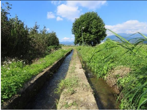
工區一及工區二中段環境