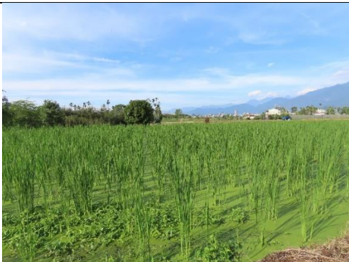
工區一及工區二周邊環境-茭白筍田