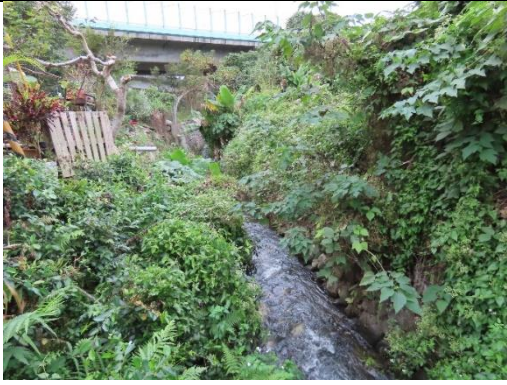
工區三施工終點環境