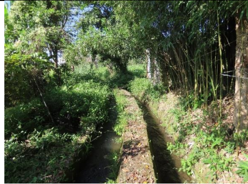
工區一及工區二中段環境