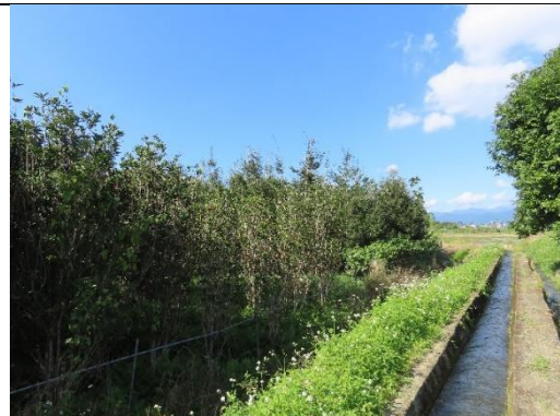
工區一及工區二周邊環境-人工林