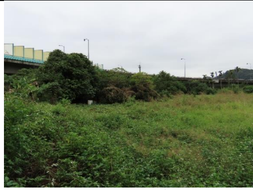
工區三周圍環境-草生地