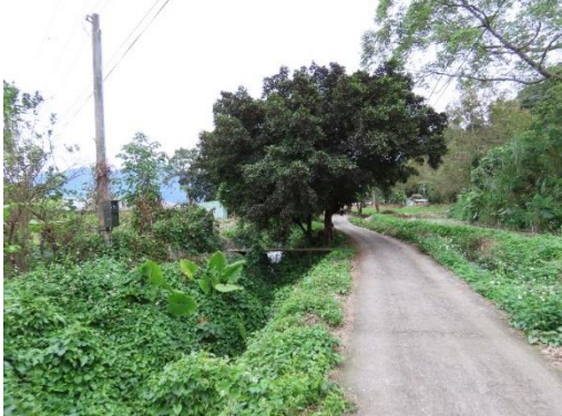
工區三周圍環境-道路