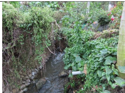
工區三施工中段環境