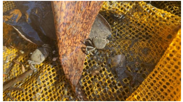
時間：113年11月4日 說明：工區2水圳生物