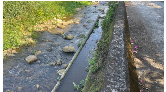
時間：113年11月4日 說明：工區3終點