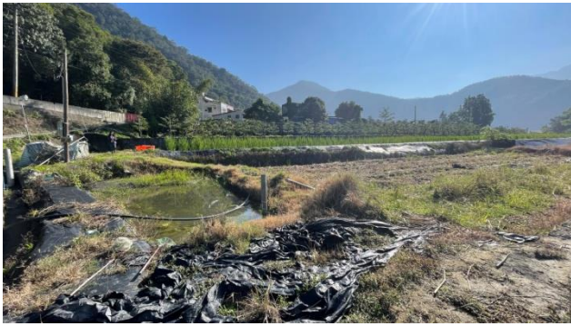
時間：113年11月4日 說明：工區2周邊農地