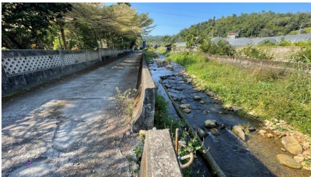
時間：113年11月4日 說明：工區3起點