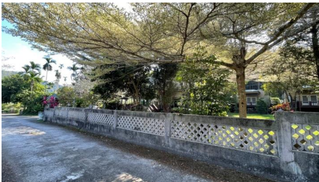
時間：113年11月4日 說明：工區3周邊建物