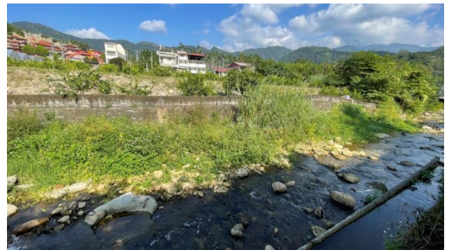
時間：113年11月4日 說明：工區3旁史港溪