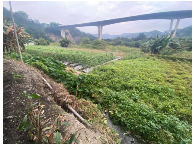
時間：113年12月19日 說明：工區周邊農地