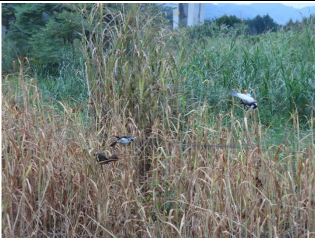
時間：113年12月19日 說明：工區周邊農地設置捕鳥網