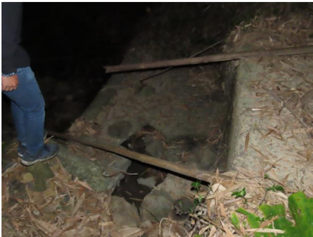
時間：113年12月19日 說明：工區現況