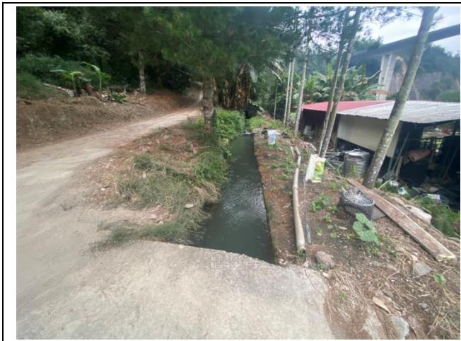
時間：113年12月19日 說明：工區現況