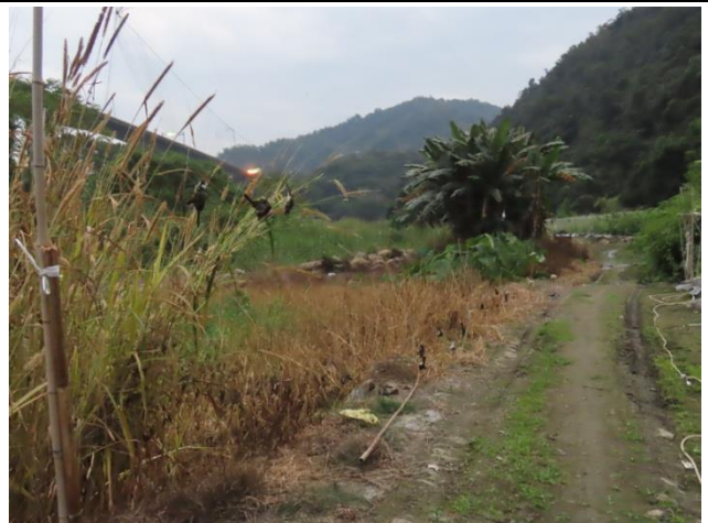
時間：113年12月19日 說明：工區周邊既有便道