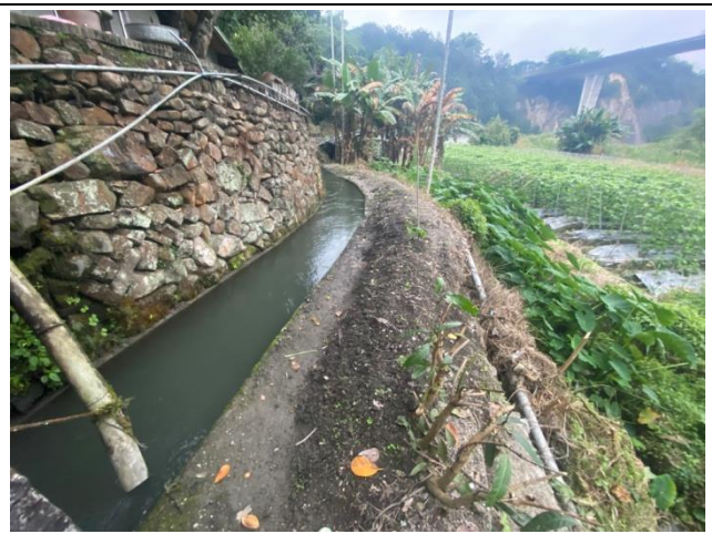
時間：113年12月19日 說明：工區現況