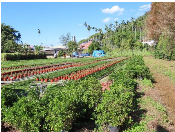
周圍環境_園藝苗圃