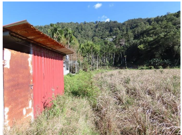
周圍環境_休耕筊百筍田