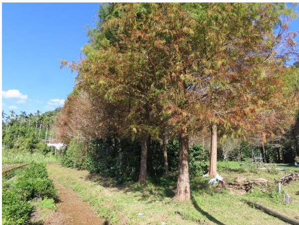
周圍環境_落雨松人工林