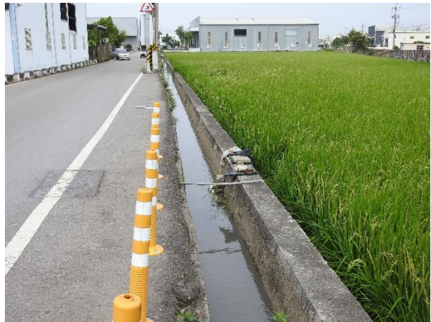
阿罩霧第二幹線喀哩1號埤支線1分線3小給環境現況

計畫範圍周遭主要環境類型包括農耕地、公園綠地、道路、建物等，植被以農田鄉間植物與人工栽植的植物居多。農耕地以稻米為主，田埂上有耳葉水荳菜、香附子、鴨舌草散生；公園綠地紀錄有落羽松、桂花、龍眼等；道路周邊紀錄有長柄菊、孟仁草、繖花龍吐珠等；建物周邊紀錄有緬梔、小葉南洋杉等。現勘時紀錄褐頭鷓鴣於稻米上停棲、白尾八哥、麻雀於電線上停棲、多線真稜蜥於建物周邊上攀爬。