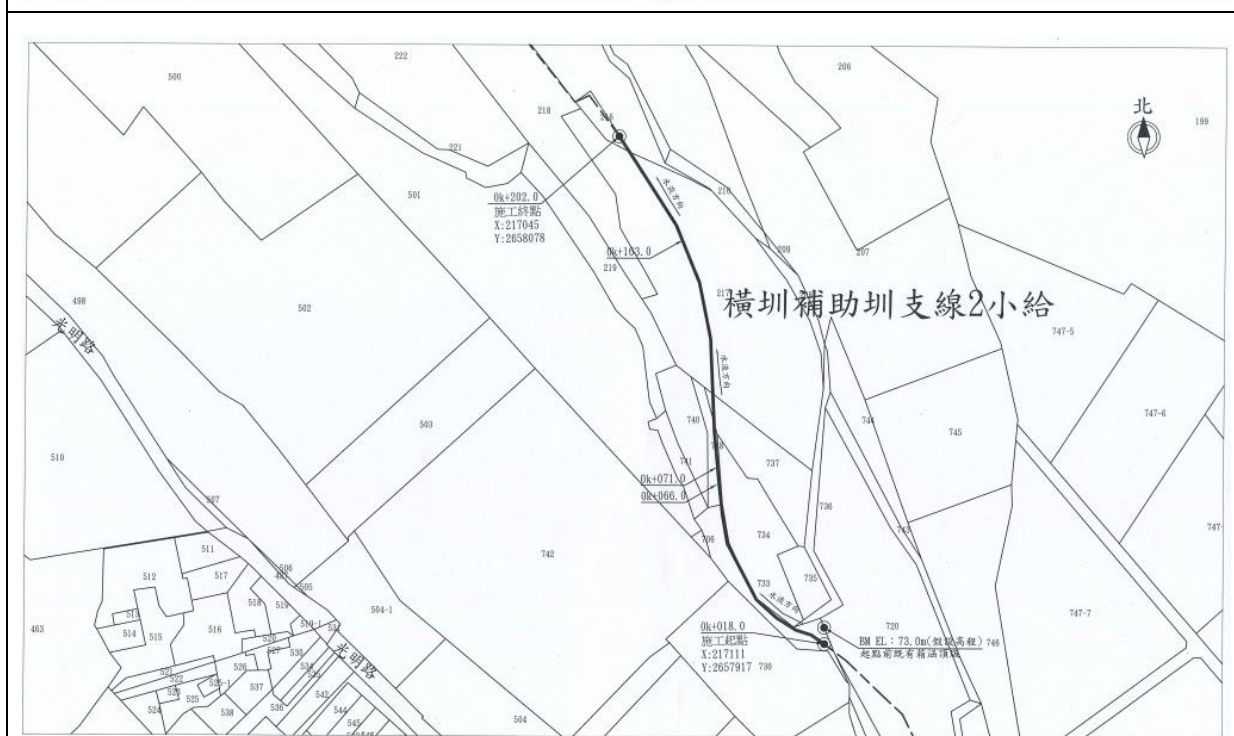
橫圳補助圳支線2小給施工平面圖 霧峰區南勢東段 比例尺:1/1000 (座標系統97TM2)

備註：本表由主辦生態團隊填寫，由主辦機關提供現況概述欄請就工地附近地形、土地利用、災情及以往處理情形簡單描述；擬辦工程內容欄未列之工法，請在其他項內填寫工法、計價單位、數量等。