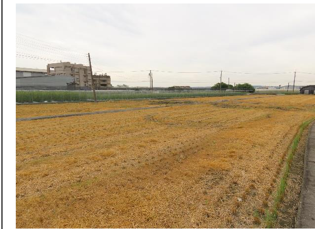
時間：113/11/19 說明：吳厝本圳支線周邊農地