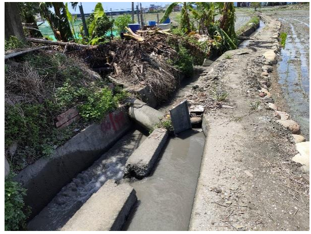
時間：113/11/19 說明：橫圳補助圳支線 2 小給