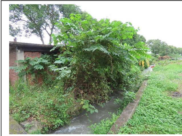
時間：113/11/19 說明：第一圳二幹線