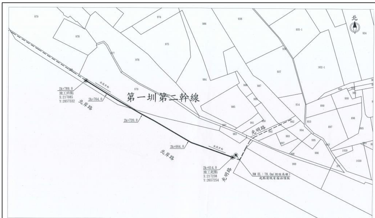
第一圳第二幹線施工平面圖 霧峰區南勢東段 比例尺:1/1000 (座標系統97TM2)