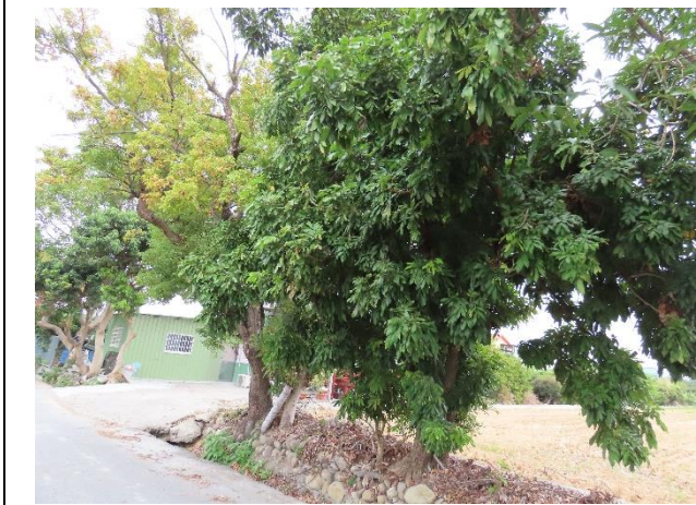
時間：113年12月16日 說明：周邊環境