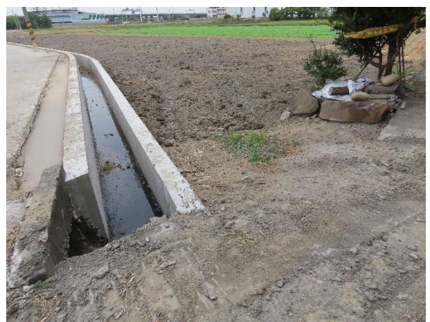
時間：113年12月16日 說明：周邊環境