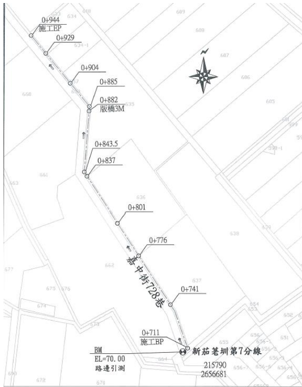
新茄荖圳第7分線 施工位置圖 芬園鄉嘉興段 S=1/1000