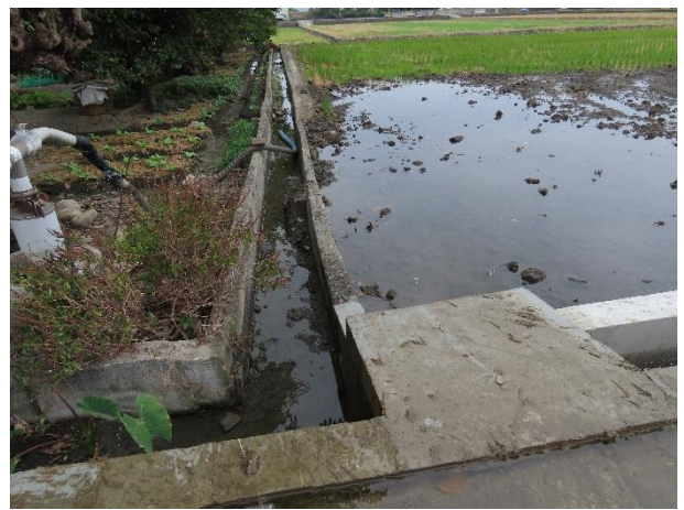
時間：113年12月16日 說明：周邊環境