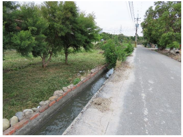
時間：113年12月16日 說明：周邊環境