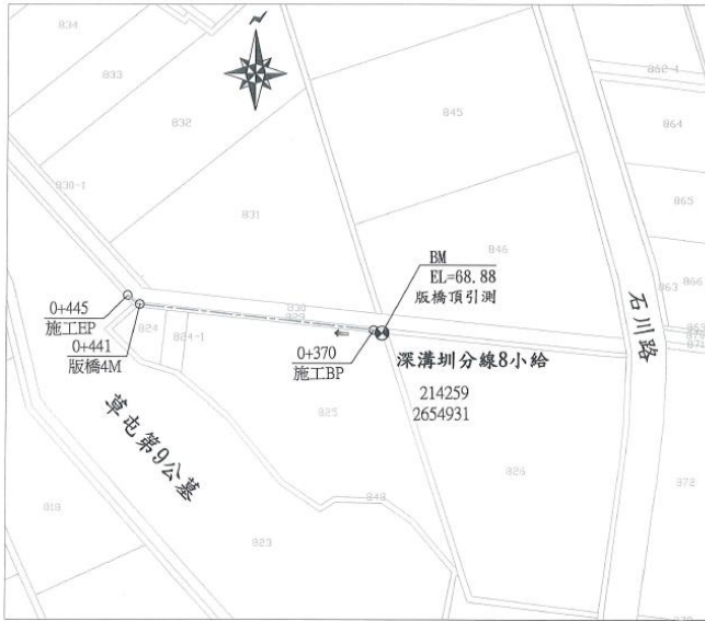
深溝圳分線8小給 施工位置圖 芬園鄉嘉興段 S=1/1000