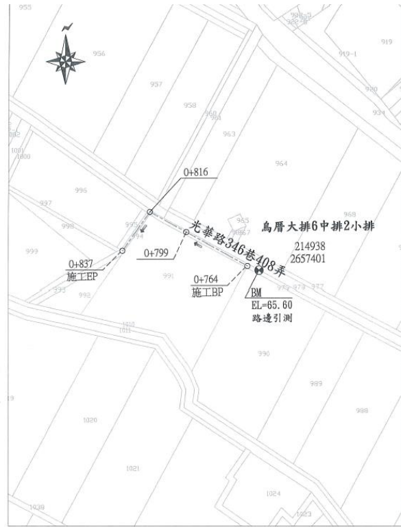
烏厝大排6中排2小排 施工位置圖 芬園鄉嘉興段 S=1/1000