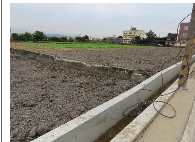
時間：113年12月16日 說明：周邊環境