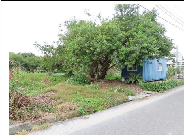
時間：113年12月16日 說明：周邊環境