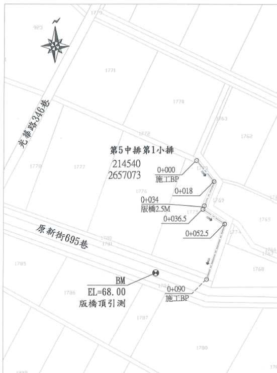
第5中排第1小排 施工位置圖 芬園鄉嘉興段 S=1/1000