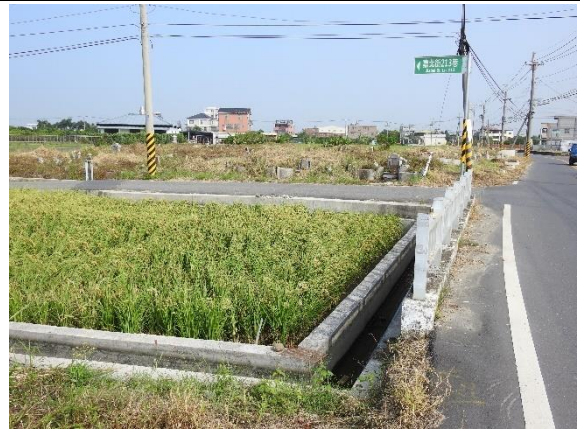
時間：113年11月4日 說明：土地公埤分線周邊環境