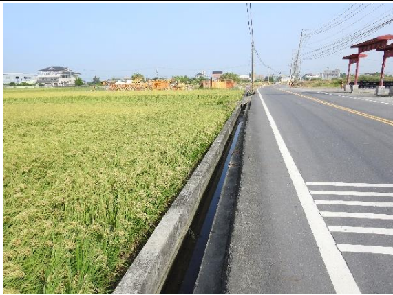
時間：113年11月4日 說明：土地公埤分線周邊環境