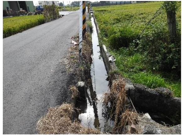
時間：113年11月4日 說明：過寮圳分線第2小給周邊環境