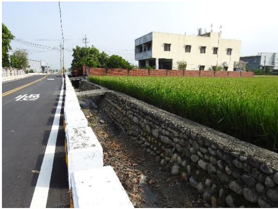
時間：113年11月4日 說明：烏厝大排第4中排周邊環境