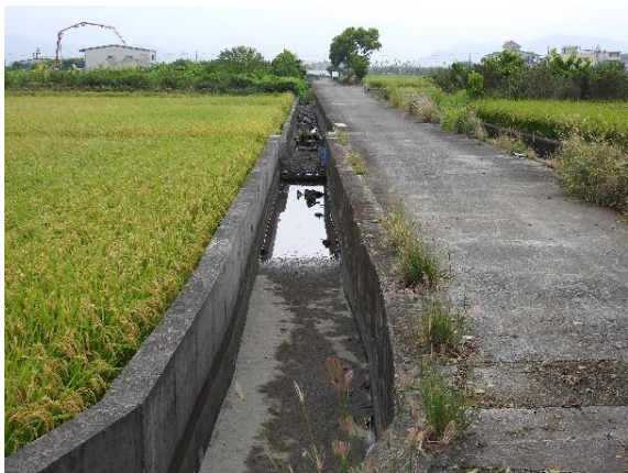
時間：113年11月4日 說明：新圳周邊環境