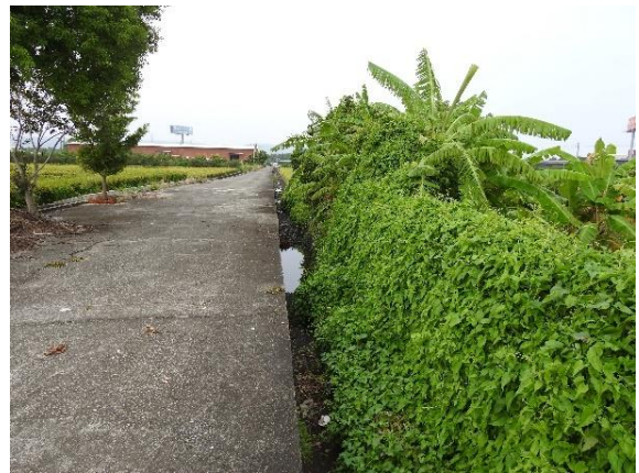
時間：113年11月4日 說明：新圳周邊環境