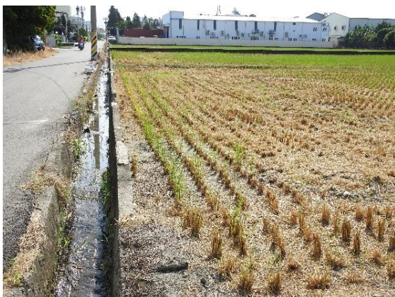
時間：113年11月27日 說明：阿罩霧第二幹線喀哩2號埤支線1分線4小給周邊環境