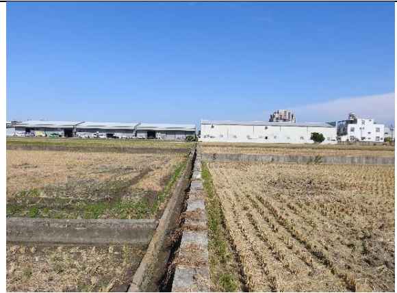
時間：113年11月27日 說明：溪埧排水東園1圳支線2分線3-2小給周邊環境