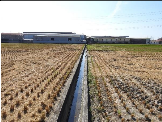
時間：113年11月27日 說明：溪埧排水東園1圳支線2分線3-2小給周邊環境