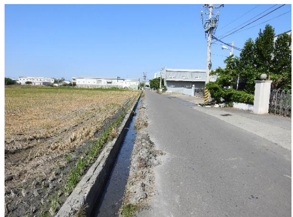
時間：113年11月27日 說明：阿罩霧第二幹線喀哩2號埤支線1分線4小給周邊環境