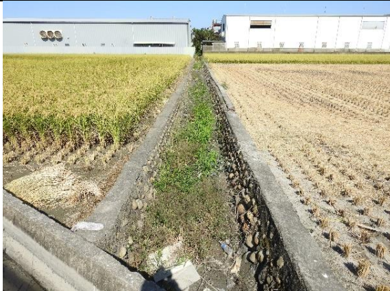
時間：113年11月27日 說明：溪埧排水20-2小排周邊環境