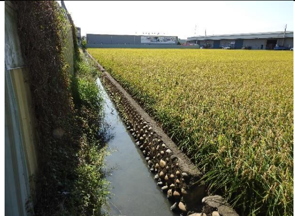
時間：113年11月27日 說明：溪埧排水20-2小排周邊環境