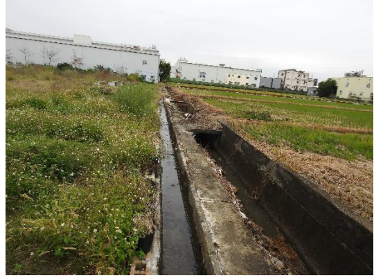
阿罩霧第三幹線 1 支線 3 分線 1-1 小給環境現況