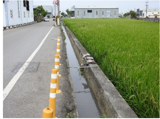
溪埤排水 20-2 小排環境現況

計畫範圍周遭主要環境類型包括農耕地、道路、建物等，植被以農田鄉間植物與人工栽植的植物居多。農耕地以稻米為主，田埂上有鱧腸、芒稈、雙花草散生；道路周邊紀錄有煉莢豆、大花咸豐草、倒刺狗尾草等；建物周邊紀錄有桂花、九重葛、月橘等。現勘時紀錄白尾八哥、洋燕、褐頭鷓鴣於電線及灌叢上停棲。