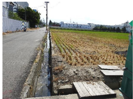
阿罩霧第二幹線喀哩2號埤支線1分線4小給環境現況