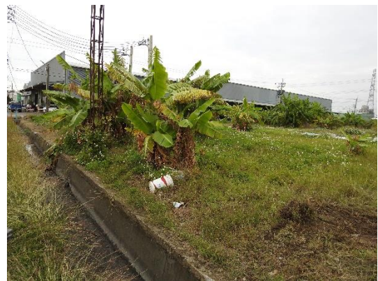
溪埤排水螺潭1中排1分線環境現況