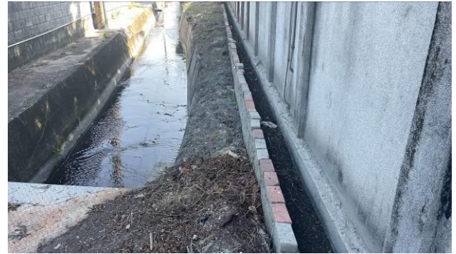
工區 3 終點