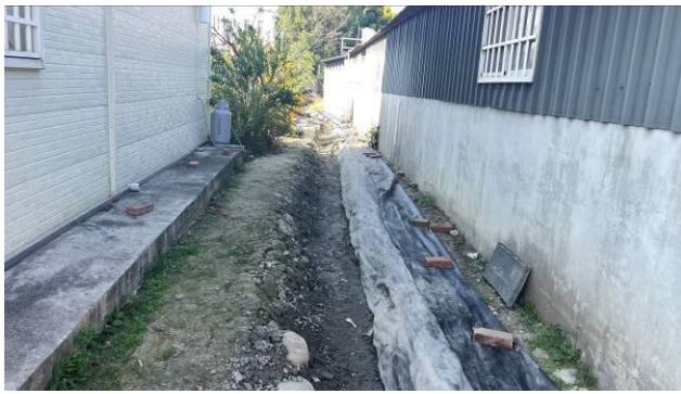
工區 2 起點