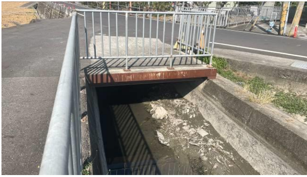
工區 1 起點