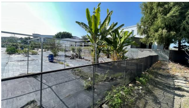
工區 2 周邊農地