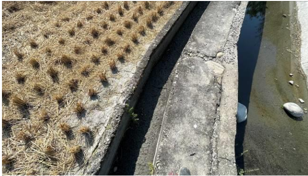
工區 3 起點