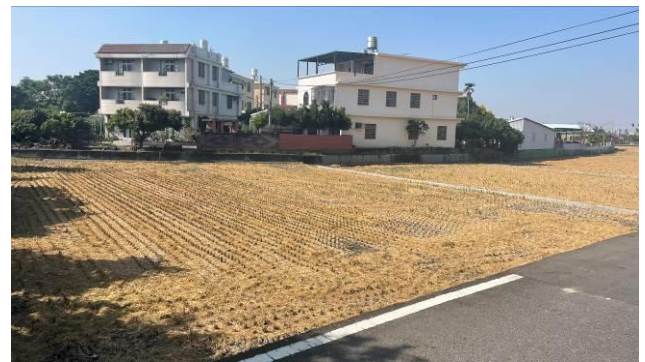
工區 1 周邊農地