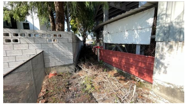
工區 2 終點