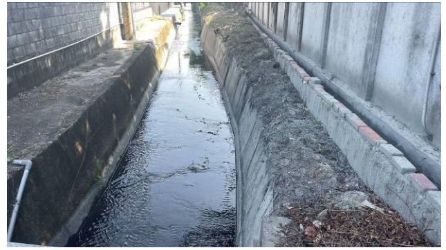
工區 1 終點