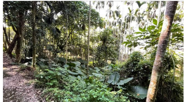
工區 1 檳榔園演替

本計畫的水域棲地主要為既有水圳翻新，施工前需提前斷水減輕對水域生態之影響，既有水圳兩旁可見蜻蛉類生物停棲利用，底質多為泥沙淤積，並可見臺灣蜆的殘骸，評估其生態功能性不差。