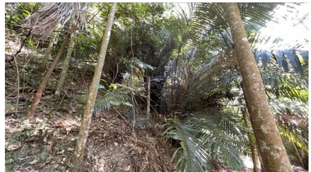
工區 2 周邊檳榔園演替