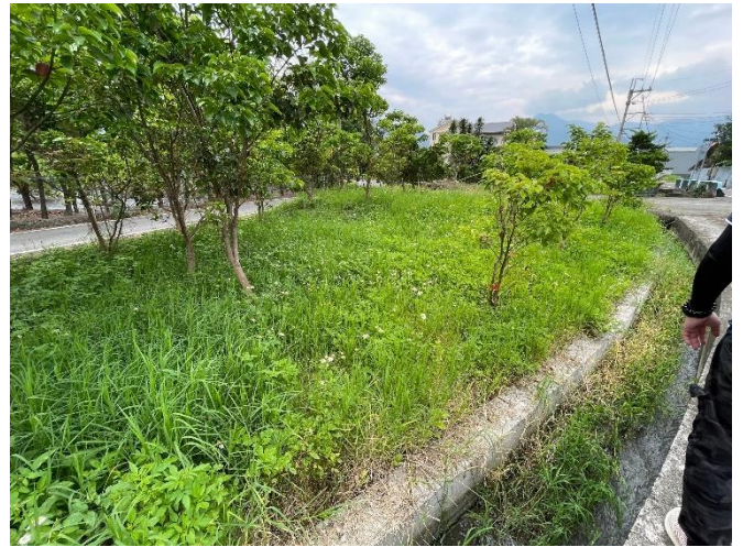
說明：工區二 安浦段 163 地號 現況