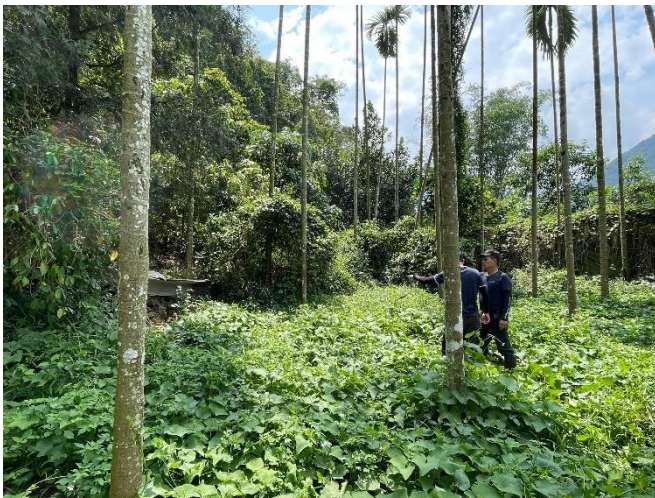
說明：工區三 東埔段 493 地號 現況