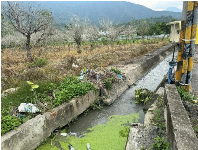
說明：工區一 牛尾段 673 地號 現況